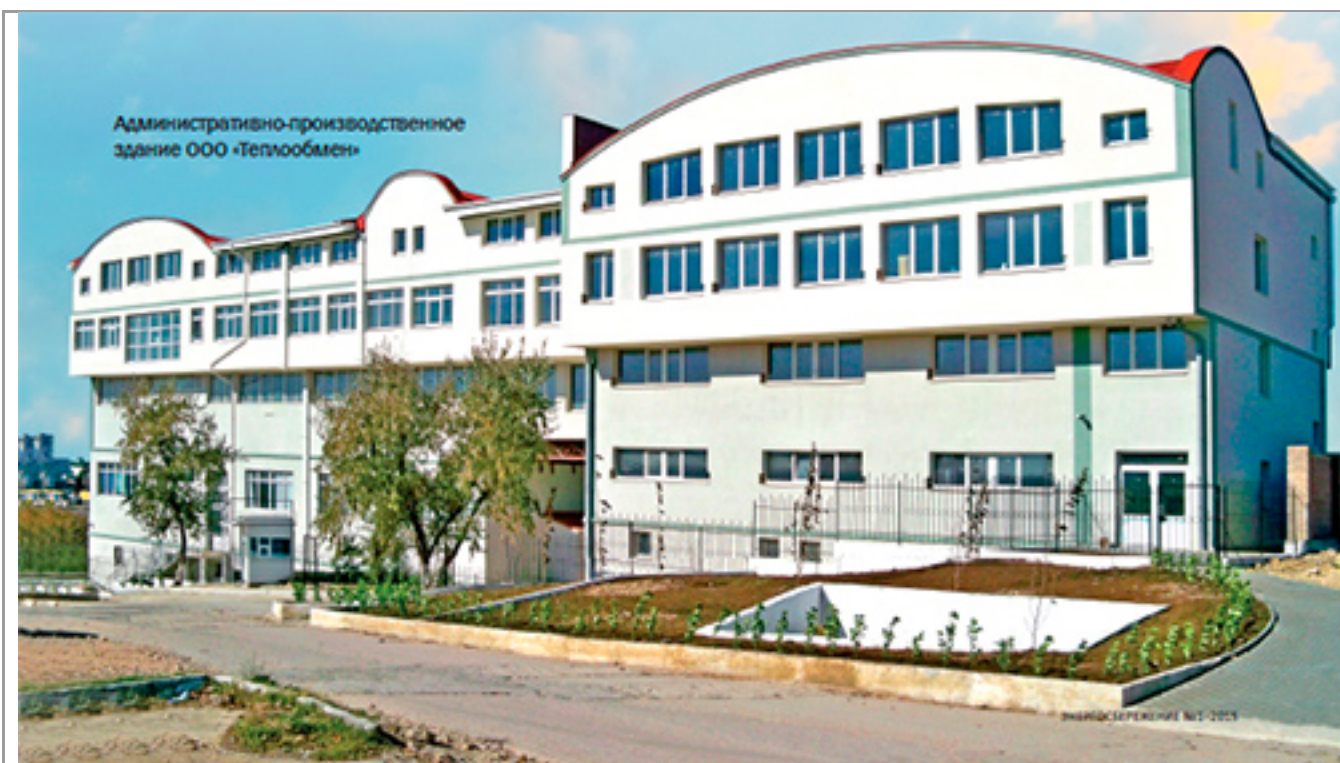
Административно-производственное здание ООО «Теплообмен»