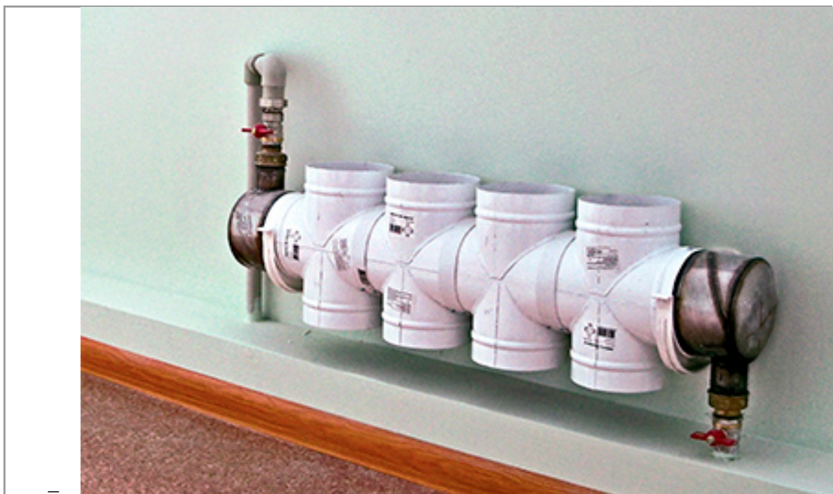
– Рисунок 4.